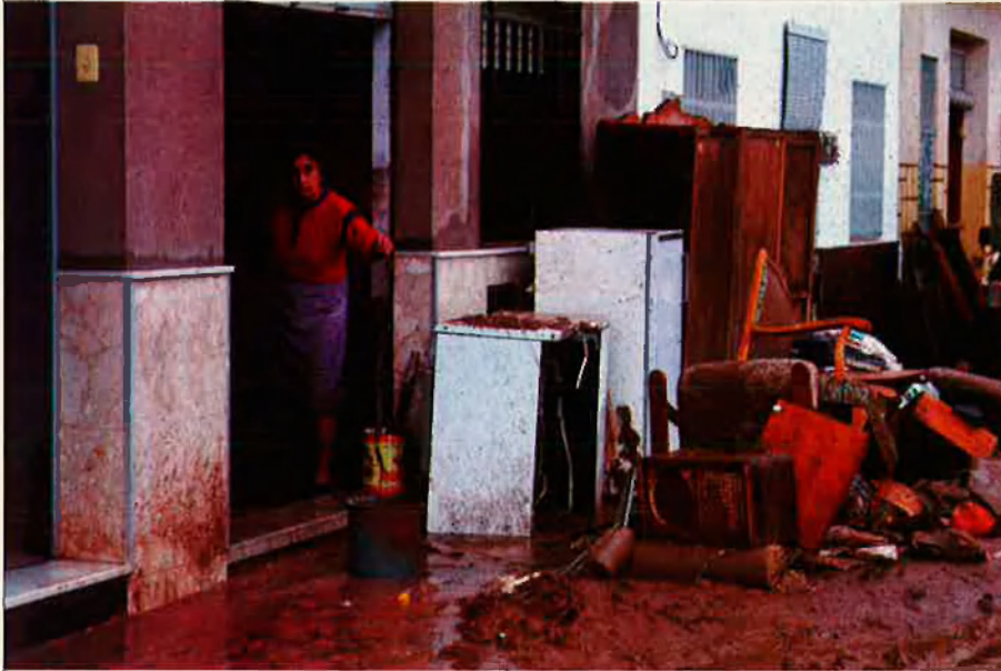
La Ribera encara té por de les inundacions.