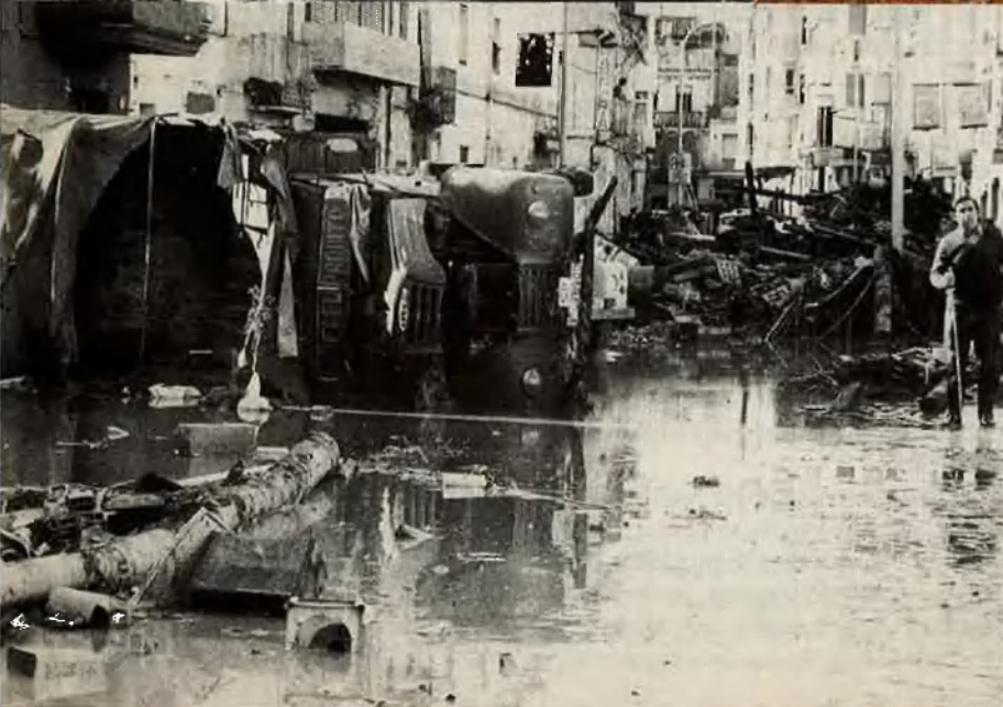
Dalt i baix, les inundacions tornaren a la Ribera el 1987. Al centre, la presa de Tous després del trencament i en l'actualitat.

la del conseller d'Interior, Felip Guardiola : "Aquesta manifestació és injustificada".