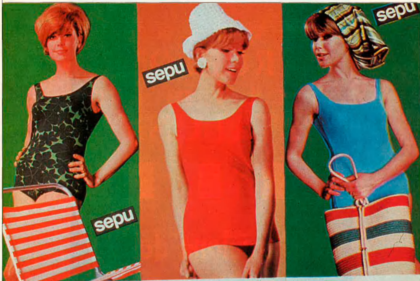
Modelo S. SEBASTIAN Traje baño Maillot, espuma Nylón, varios colores. Modelo Olímpicas