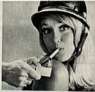
Prefiero fuego Consul (está menos visto)