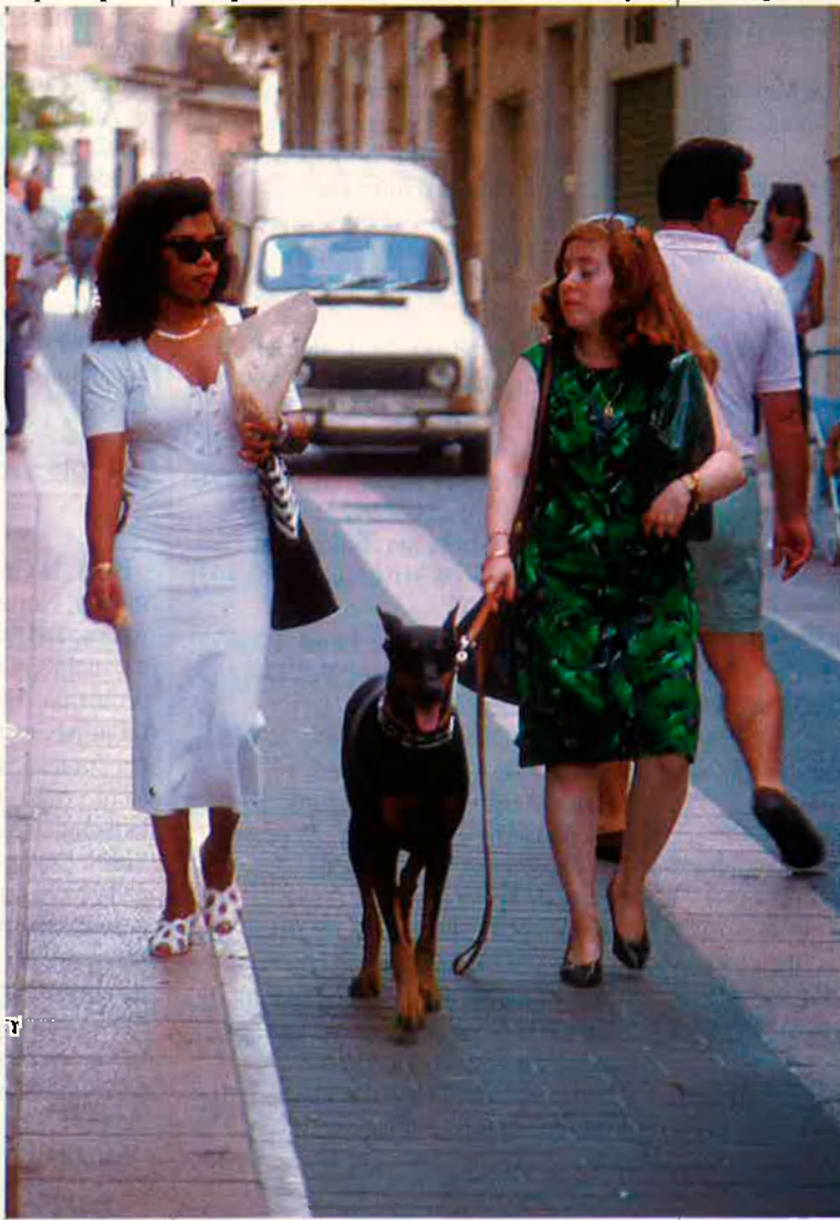
El nombre d'agressions contra la dona ha augmentat considerablement.

Les seqüeles de la violació són complexes. Durant la primera fase del que es denomina síndrome traumàtica, la víctima d'una agressió sexual se sent en xoc, desitja negar el que ha passat. Pot estar setmanes immòbil, sense dormir, amb nàusees i vòmits. Té por de l'embaràs i de la sida. Tots aquests símptomes són superables en una segona fase, quan la dona supera el trauma post-violació, que pot durar anys. En la majoria de casos apareixeran dificultats en les relacions afectivo-sexuals posteriors.