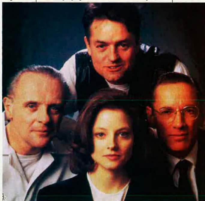
El silenci dels anyells.

La resposta fàcil i tradicional al dilema és que als americans els agrada molt això de l'aparatositat tecnològica. Que xalen i se senten molt segurs tot usant aparells i és per això que hi aboquen diners, encara que no serveixin per a res. Conjuren d'aquesta manera, els dimonis d'una societat que crea violèn-