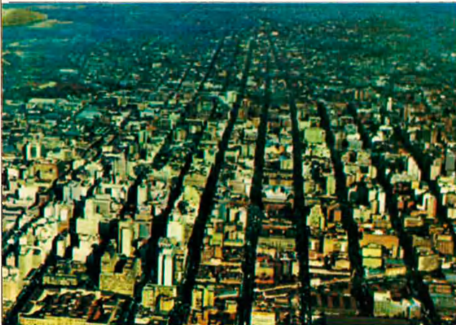
Johannesburg continua sent una ciutat destrossada pel conflicte social que es viu a Sud-àfrica.