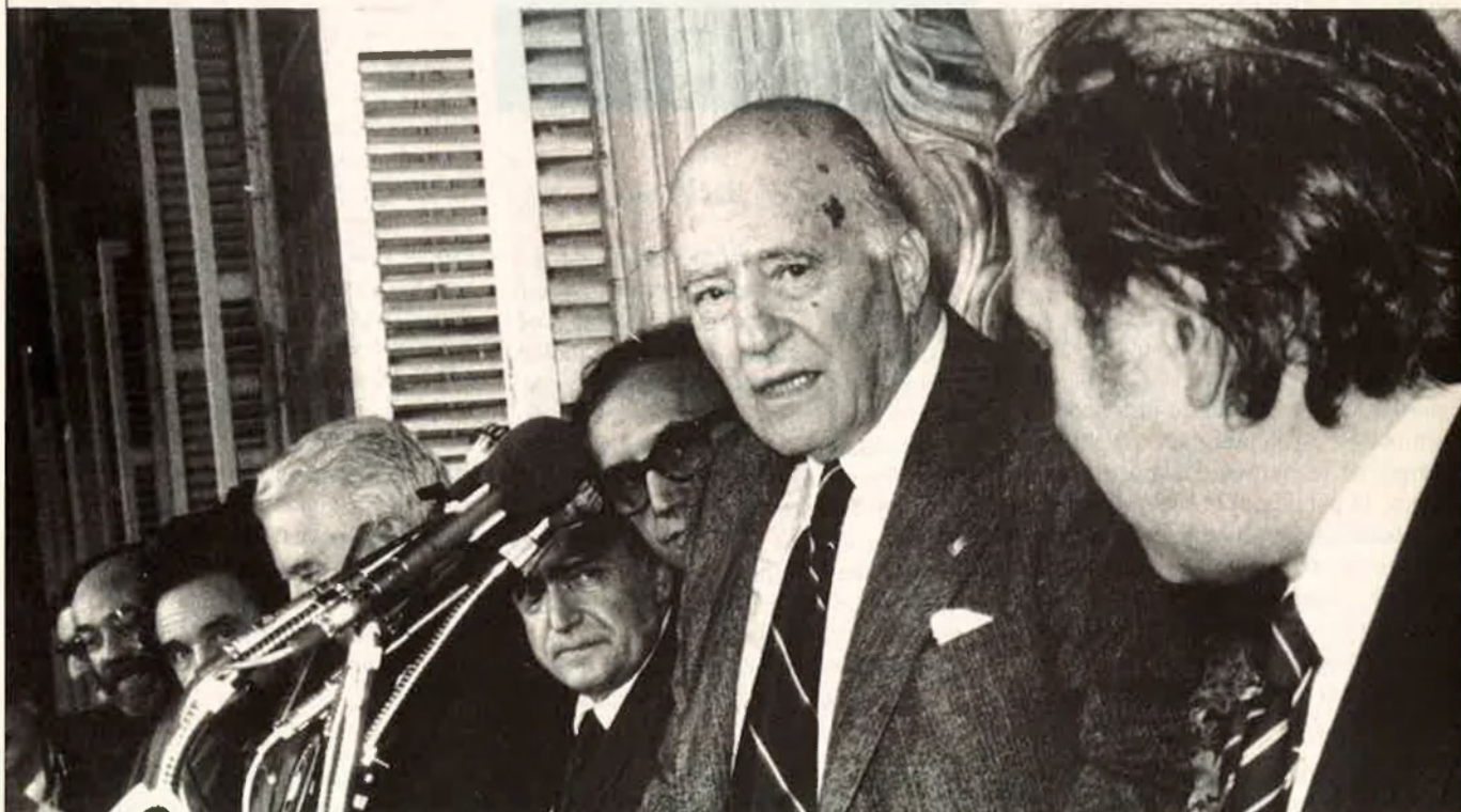
Tarradellas al balcó del palau de la Generalitat de Catalunya.

Fa tres mesos que Josep Benet publicava el seu anunciad llibre sobre Josep Tarradellas i, malgrat el seu èxit editorial, fins ara no ha provocat cap reacció ni en favor ni en contra. Un silenci difícil d'interpretar.