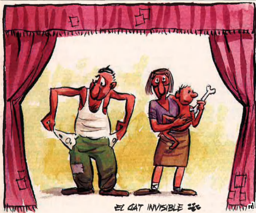
EL GAT INVISIBLE

tofinançament de les empreses, els responsables de l'economia catalana deien que la pèrdua de beneficis de les empreses havia estat l'any 1990 d'un 16% respecte als resultats de l'any anterior. La tònica a la baixa continua sent la mateixa.