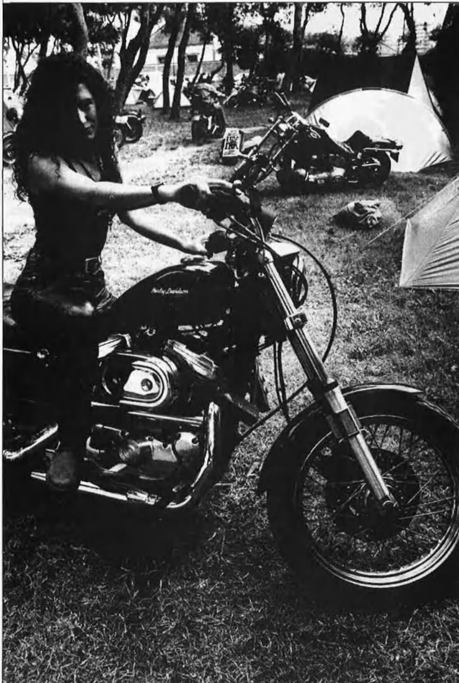
Erotisme i maldat, els dos atractius de la dona Harley.