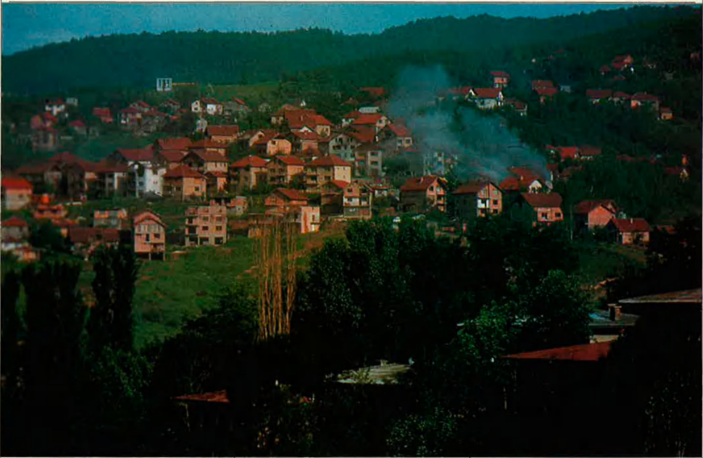
Iugoslàvia s'ha enfonsat pel secessionisme de Croàcia i Eslovènia, que volien aconseguir per la força els seus propis estats".