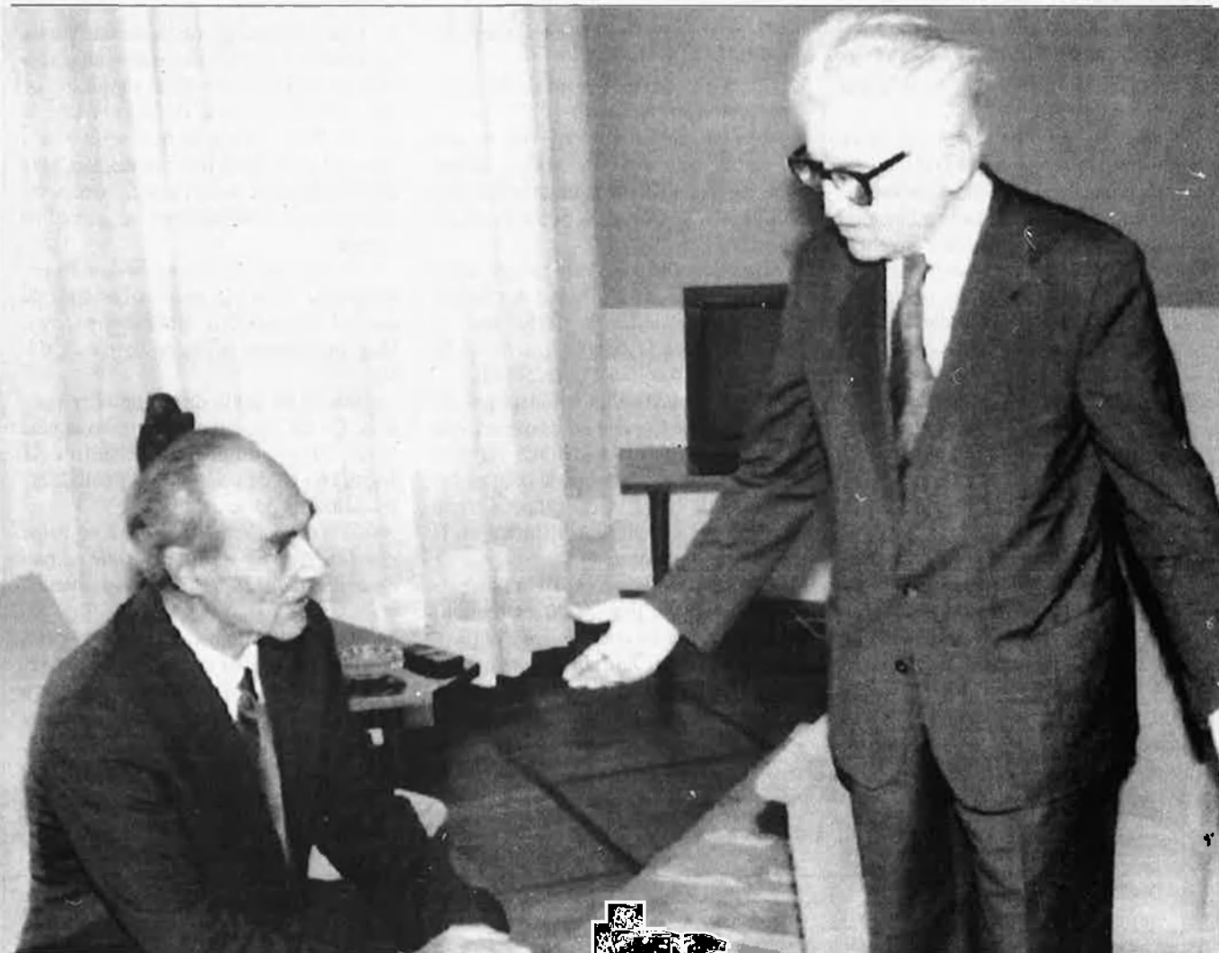
Dobrica Cosic rep contínues acusacions d'ambivalència amb el dirigent serbi Milosevic, ja que en el seu nou càrrec no té el control de les armes sèrbies..