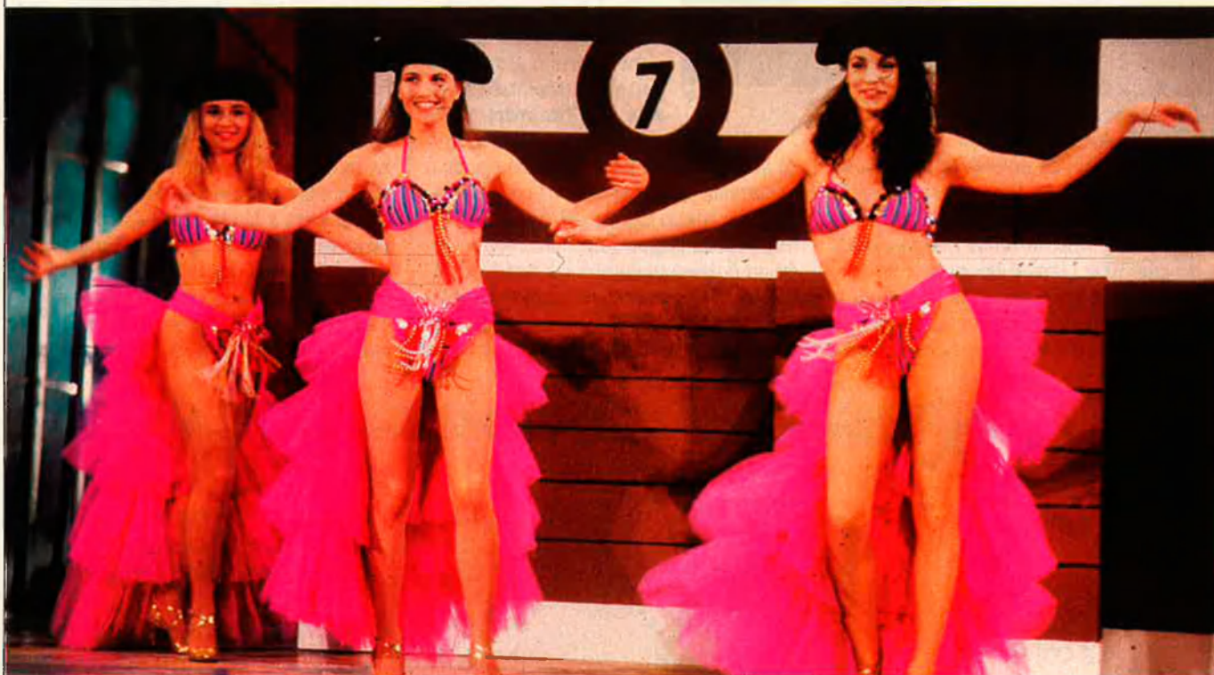
Tele 5 experimenta una lleugera tendència a la baixa a causa de la seva programació de poca qualitat.

Durant aquestes últimes setmanes han tingut lloc canvis significatius en la composició de l'accionariat d'Antena 3. Aquest fet, juntament amb els canvis recents de Tele 5 i el dèficit de Canal Plus en el passat exercici, fa que les cadenes privades hagin passat a primer pla de l'actualitat.