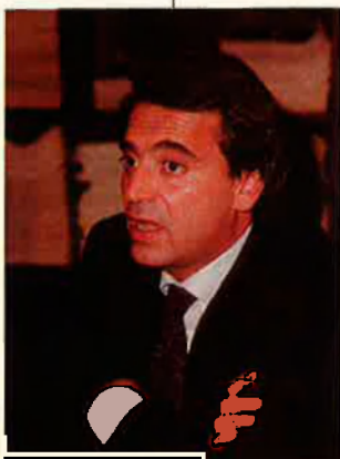
Antonio Asensio, nou president d'Antena 3 TV.