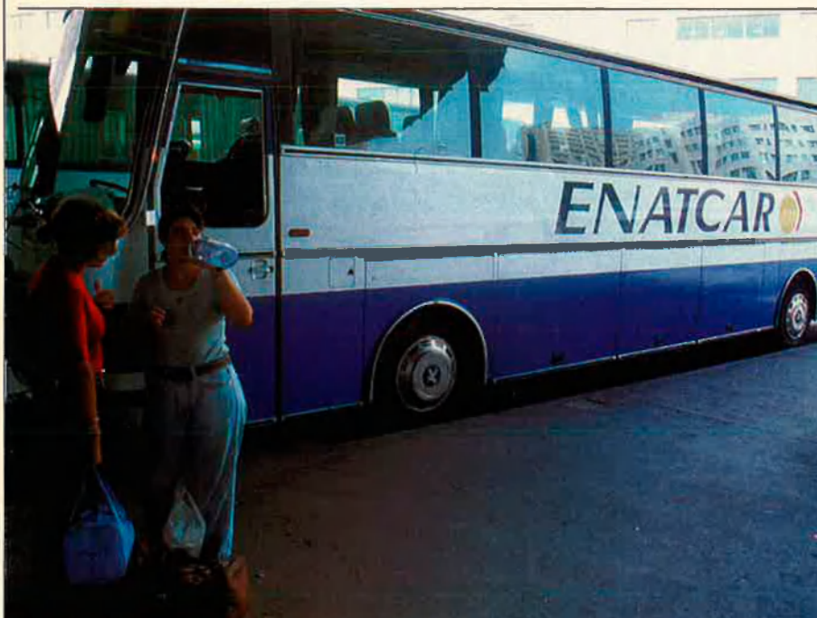
L'arribada d'Enatcar eliminà moltes línies pirates.