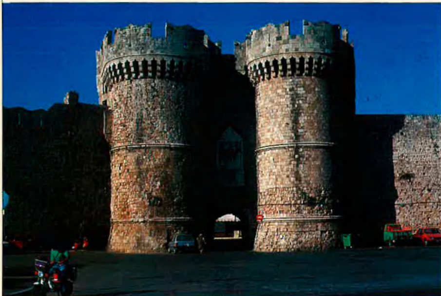
Una de les portes d'entrada a la ciutat de Rodos guarda una certa familiaritat amb les de Quart, a València. VICENT A. MORENO

d'aquesta gent, més preocupada d'eixir en les fotos que d'admirar. ¡Si Fídies alçara el cap! Els museus a Atenes, i en general a Grècia, són, la major part, un magatzem d'artefactes. Però s'ha d'intentar perdonar aquesta circumstància, perquè el material dipositat és d'una bellesa impressionant. Recomanem, a més, el Museu Nacional, el Benaki (la millor col·lecció del món d'icones bizantines), el d'Art Clàssic Goulandris (l'únic plantejat amb els últims avanços de la museística moderna) i el que hi ha a l'Àgora.