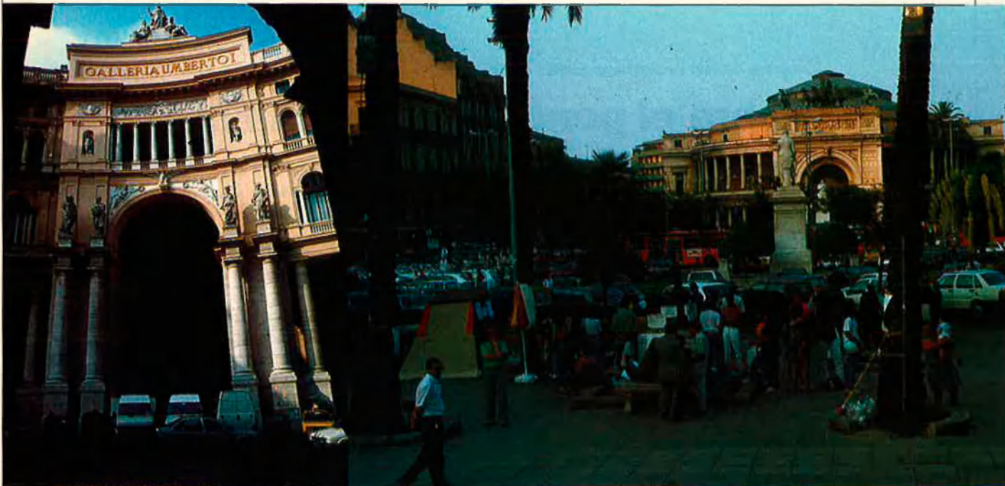
A l'esquerra, Nàpols: la restauració que avança. A la dreta, Palerm: vaga de fam contra la màfia.