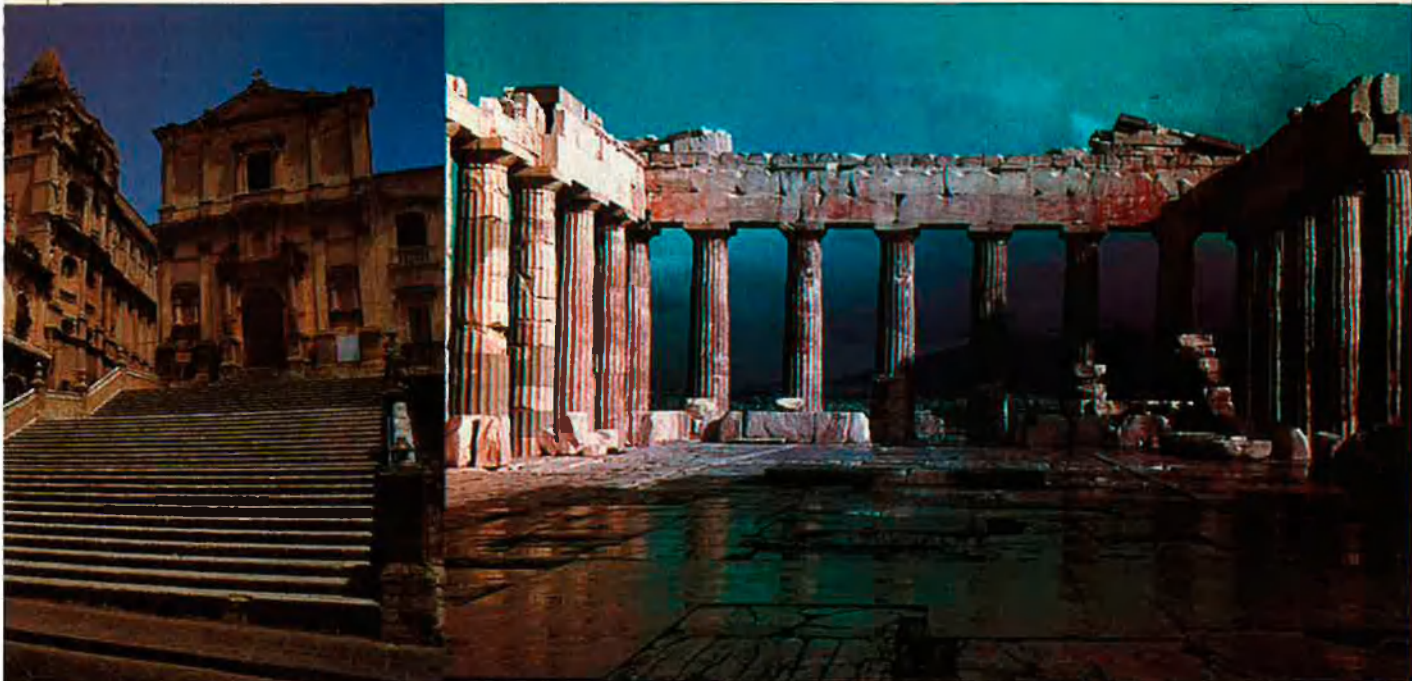
A l'esquerra, Noto: el Barroc que s'ensorra. A la dreta, el Partenó, en època catalana va ser convertit en una església dedicada a Santa Maria. Posteriorment, el venecians el van transformar en polvorí i va esclatar, deixant-lo en l'estat actual.