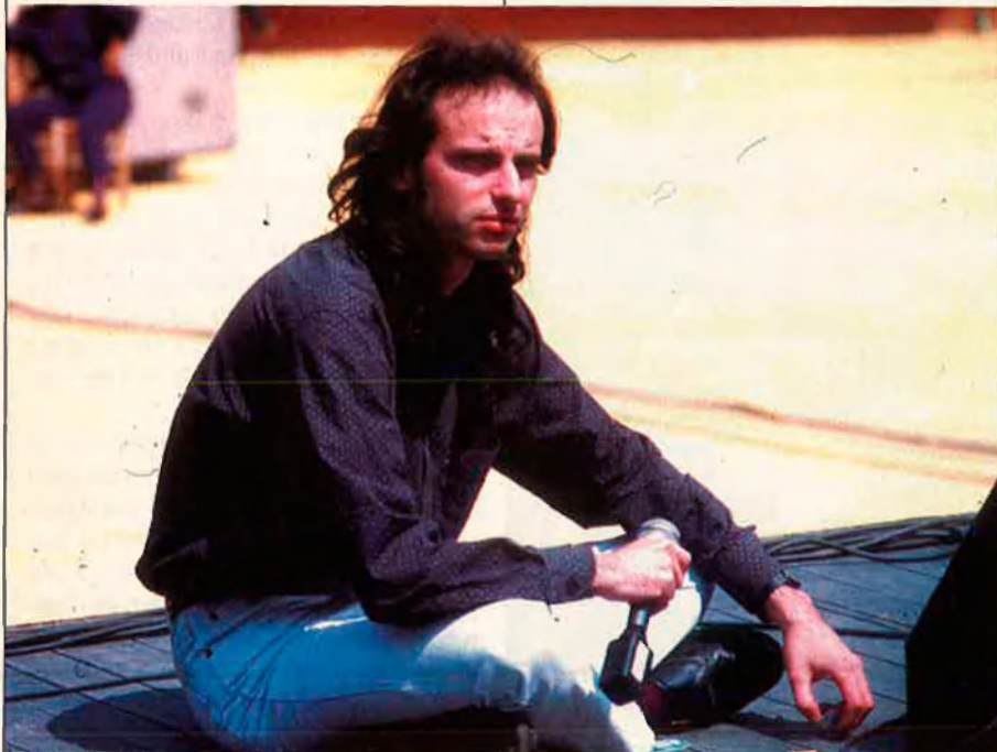
Lluís Gavaldà, cantant d' Els Pets .