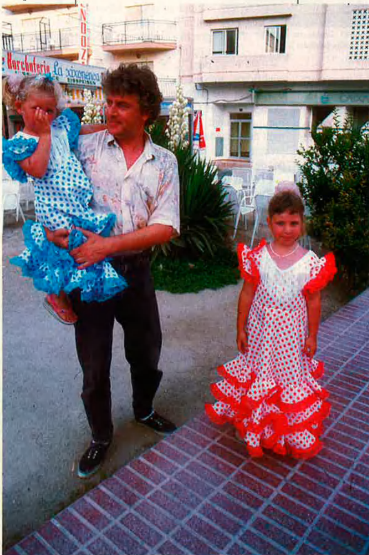
A l'Alfàs, el 80% de la població és estrangera, però diu que està integrada.

Aquesta preocupació, però, no existiria si no fos pel fet que en alguns municipis d'aquestes comarques alacantines la població estrangera supera l'autòctona. Els casos més evidents són l'Alfàs del Pi (on el 80% de la població és estrangera), Calp, Altea, Benidorm, la Vila Joiosa, Torrevella, Xàbia, la Nucia i Dénia. Localitats on els residents comunitaris van decidir un dia instal·lar-se per muntar el seu negoci o, en la