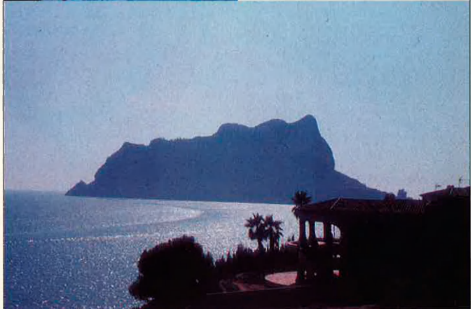
Dalt: A la Costa Blanca es publiquen diverses publicacions per als residents estrangers. Baix: Una morfologia física i climàtica excepcional i atractiva, oposada a la dels països consumidors. RAFA GIL

i Holanda, no significa que existeixi en la pràctica. De fet, resulta que l'acord bilateral es compleix en els altres països, però aquí no. Actualment, els ciutadans amb nacionalitat espanyola residents en aquests països ja exerceixen el dret a sufragi municipal.