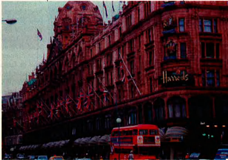
“Totes les empreses de l'estat privatitzades, per exemple la British Telecom, funcionen avui millor que no pas abans”.

—Es clar que sí! Fóra una bogeria de marcar una ratlla divisòria i haver d'elegir entre l'amistat dels socis europeus o la dels EUA, amb qui estem històricament i estretament vinculats. No hi ha elecció possible entre germà i germana.