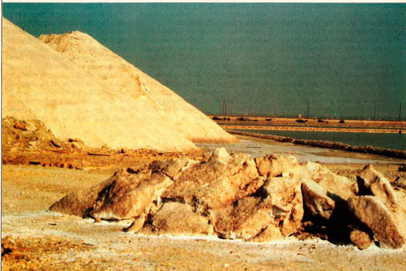
La majoria de les urbanitzacions de MASA difícilment poden superar la legalització.

"La major degradació ambiental de la zona" -afegia l'estudi arquitectònic- era l'impacte causat "per l'abús de les segones residències" i especialment per dos plans parcials", referint-se a La Torreta, de MASA, i a Los Balcones, del Banc d'Alacant, i també a la construcció en la Punta de la Víbora que voreja igualment les salines de Torrevella. El 1975, el Fons Mundial per a la Vida Salvatge havia de-