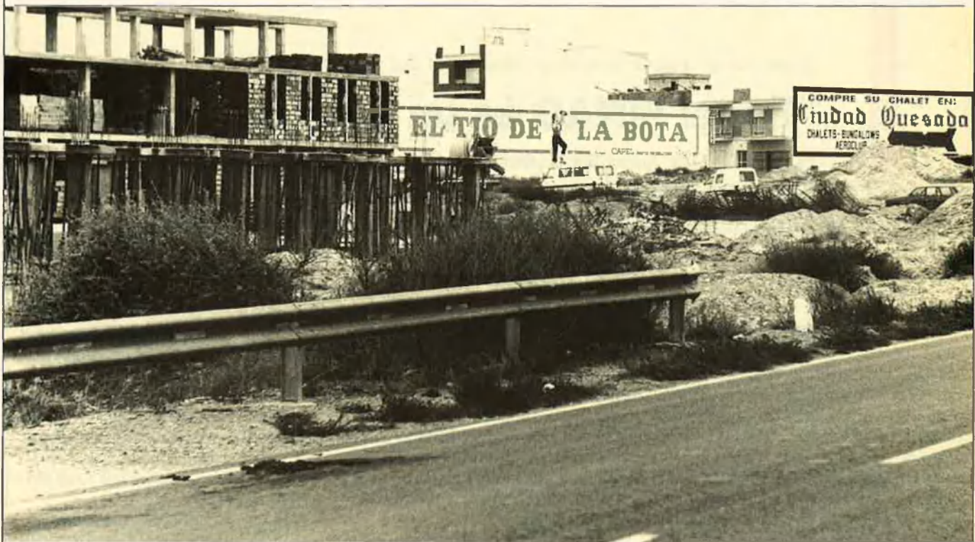
El Consell va aprovar una sanció a MASA superior als 300 milions de pessetes. ¿Només un escarment?