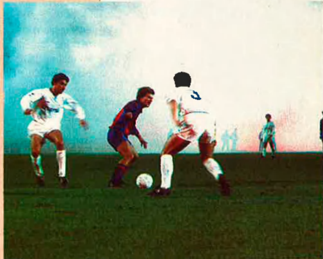
Es clubs esportius s'han convertit en societats anònimes.