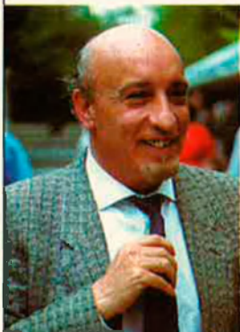
Manuel Vicent, escriptor i periodista

dir amb això que si qualsevol violació de domicili és greu, el que es faça en qualsevol mitjà de comunicació és una doble violació, contra les llibertats individuals i contra la llibertat d'expressió. I que conste que no és només una agressió contra els drets de la redacció d'EL TEMPS i dels seus lectors, sinó que ho és contra tots els ciutadans que desitgen l'existència en aquesta societat d'una pluralitat informativa real.