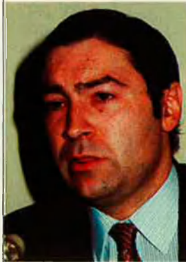
Pedro J. Ramírez, director del diari El Mundo

ens ocupa, més encara. I, sobretot, ajustada a dret. No es pot anar matant mosques a canonades. Sembla que algú s'ha excedit, allargant el braç més enllà de la mànega. De la mànega legal, és clar. I això no és bo ni ajuda a la convivència entre els ciutadans i els qui s'extralimiten en l'ús del poder que la societat els ha atorgat. Fer referència al respecte dels drets em semblaria obvi.