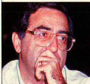
Joaquim Nadal, alcalde de Girona pel PSC

tarà molèsties i alteracions dels seus ritmes de vida habituals durant uns dies. I està disposada a la màxima col·laboració. Però, en cap cas, pot assumir que amb la cobertura d'aquest esdeveniment uns conciutadans vegin disminuïts els seus drets fonamentals. I entre aquests drets fonamentals hi ha el de la lliure convicció."