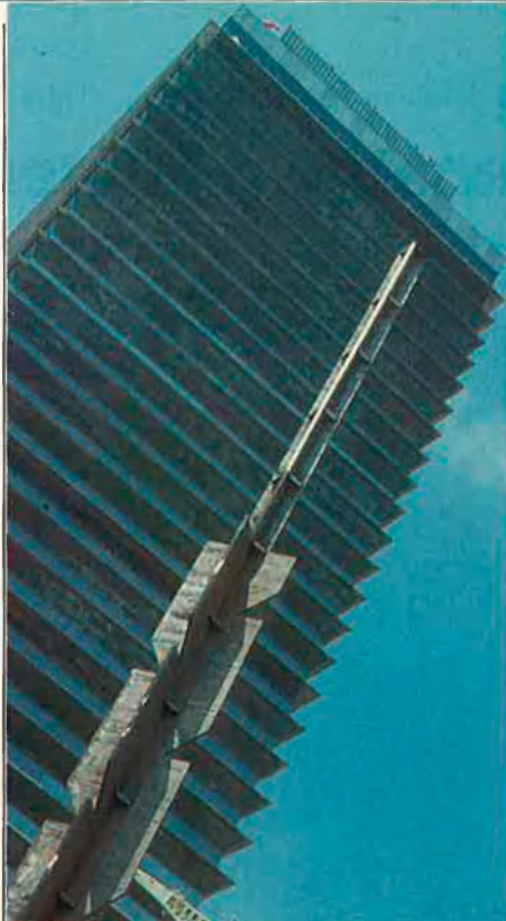
Dos colossos: la base de l'escultura davant la Torre Mapfre.

“El marc –continua Alfaro– és immillorable, perquè sense llevar-li mèrit a l'Anella Olímpica, crec que l'urbanisme que s'ha fet a la Vila Olímpica és la cosa més important de les Olimpíades. Una ciutat no pot tenir poder si no té una estructura ben feta, i en aquest sentit Barcelona ha sabut aprofitar l'esdeveniment per a dotar-se del que li faltava. Després de Cerdà, Oriol Bohigas és el gran urbanista de Barcelona. Ha fet una intervenció fortíssima per a reconciliar la ciutat amb el mar. I a més, no ha comès l'error de fer un projecte total, global i unitari: ha donat els projectes a diversos i dife-