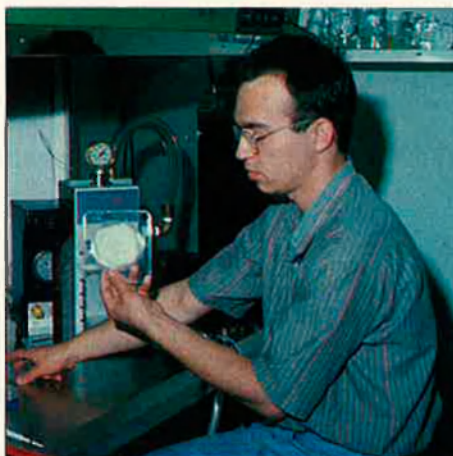
Canó de gens.

La introducció de gens estranys en les plantes s'assembla a la millora genètica que els agricultors han realitzat sempre. La diferència rau en què fins ara calia