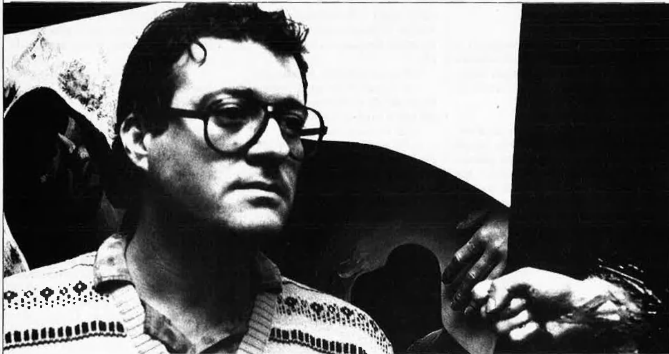
“L'única cosa que, potser, m'altera és el sentiment d'injustícia, i, tal vegada, el frau.”