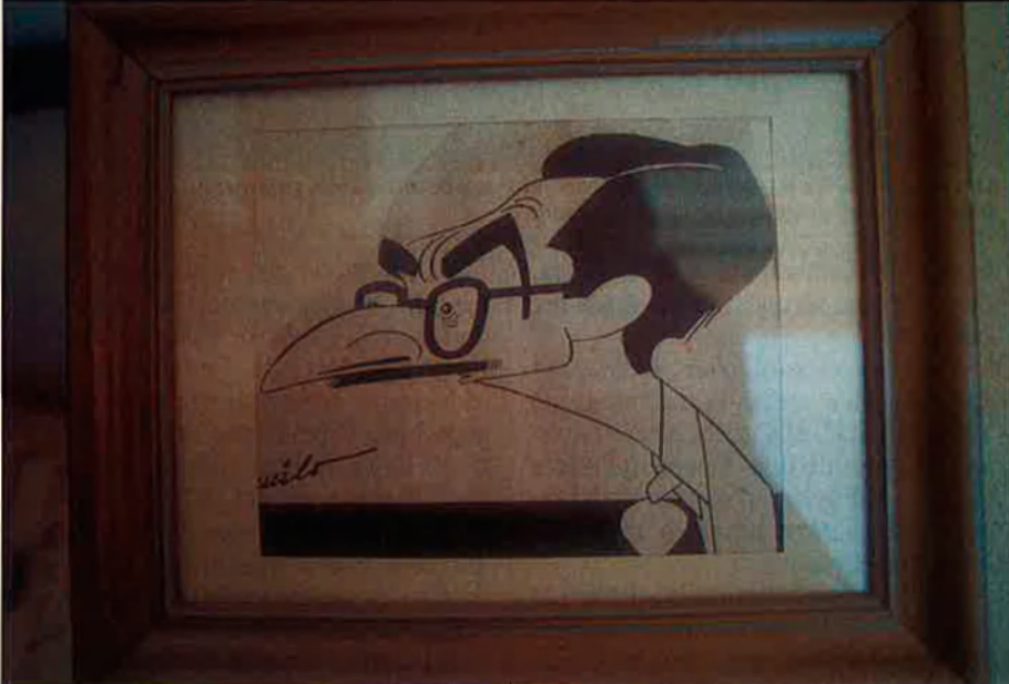
A l'esquerra, estimulants. Baix, Fuster vist per Milo. Dalt, el llicenciat en l'orla.