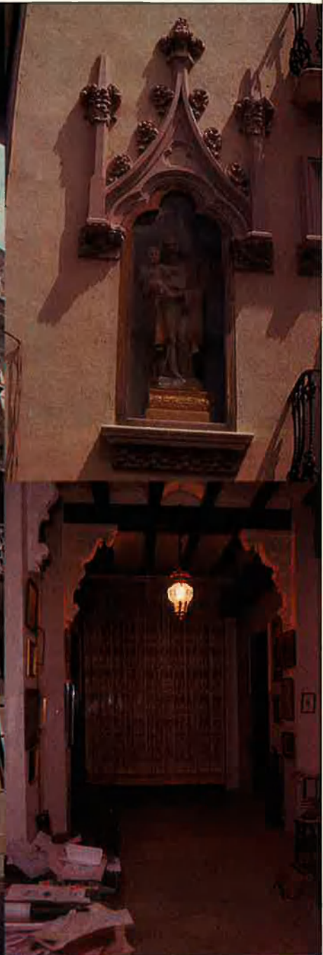
A l'esquerra, Sant Josep, 10. Dalt, el sant embotit i baix el corredor amb la cortina hissada i una llum de caramel.