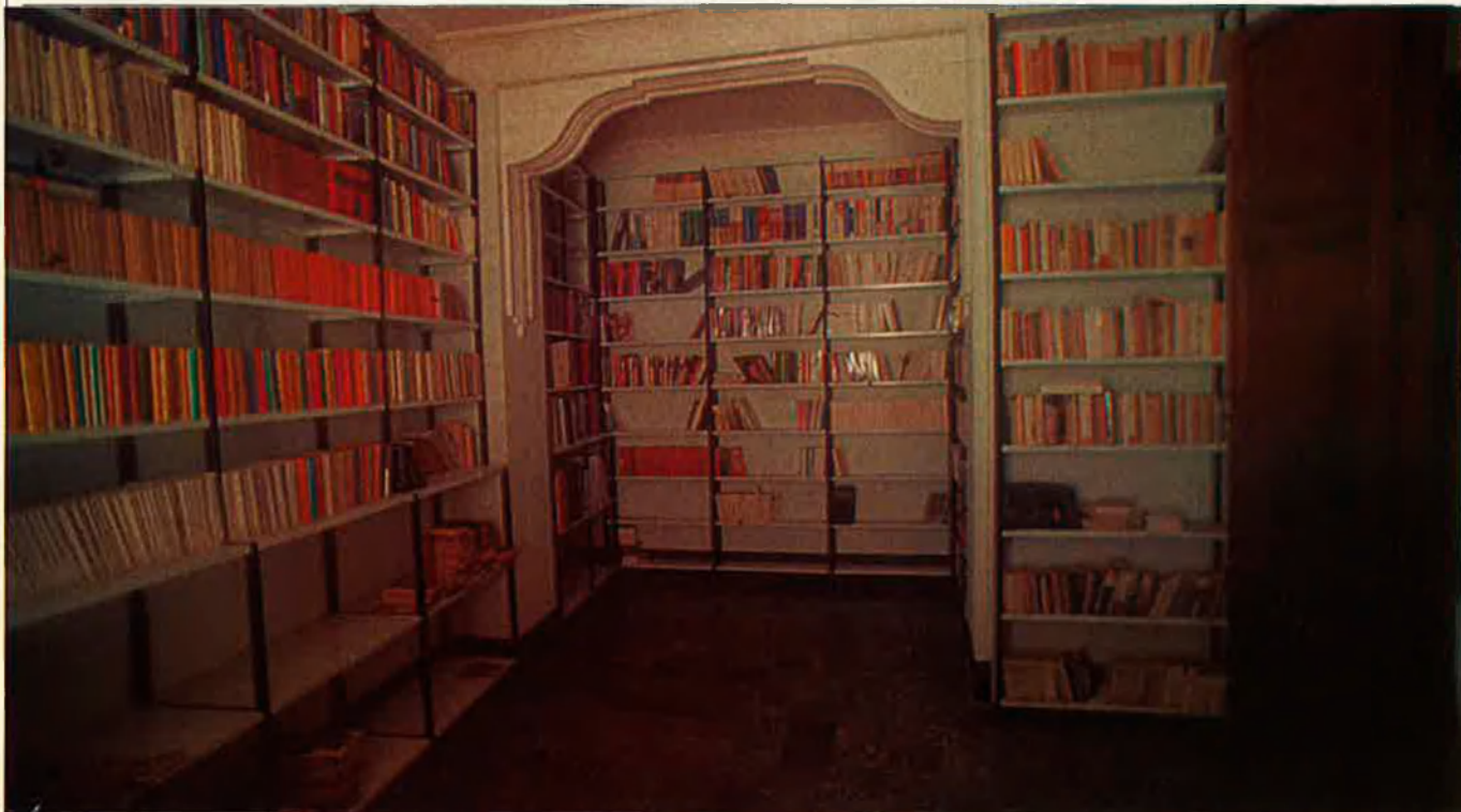
Una de les sales del pis superior dedicades a magatzem bibliogràfic.