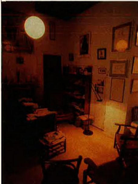
Un Fuster flamíger de l'equip Realitat. RAFA GIL Baix, la sala de les sagrades escriptures.

quida només impedita per esporàdics llauradors amfibis i uns cavallons quadrangulars que ressalten la propietat del minifundi. Inundacions calculades des de les artèries hidràuliques del Xúquer que inflaran o faran esclatar l'economia del poble a què ens dirigim.