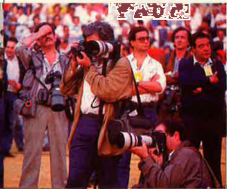
“La premsa es mou primer per la importància del personatge, però sobretot per la morbositat del mateix”.