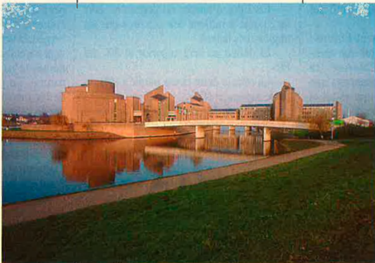
De moment els països rics de la Comunitat han augmentat les exportacions al sud d'Europa.

El Tractat de Maastricht representa una porta oberta a una Unió Europea federal (tot i que la paraula federal va quedar explícitament fora del text). Però la Unió Europea que començarà a prendre forma amb la unitat monetària com a màxim l'1 de gener de 1999, és sobretot un afermament dels Estats. Perquè els Països Catalans poguessin tenir-hi una veu més pròpia sense trencar l'actual estat caldria que la