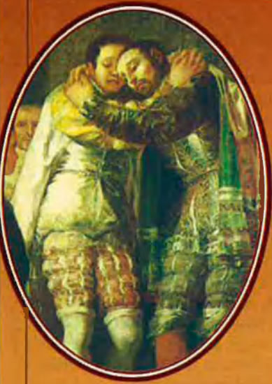
Francesc de Borja