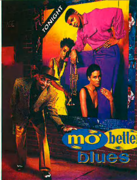
Cartell de la pel·lícula Mo'better blues .

El film necessitava el suport tant verbal com físic de Farrakhan. Lee manté també bones relacions amb altres líders americans negres com Jesse Jackson i Al Sharpton, el famós predicador que va visitar la Gran Bretanya l'any passat. Lee va fer alguns anuncis de televisió per a Jackson,