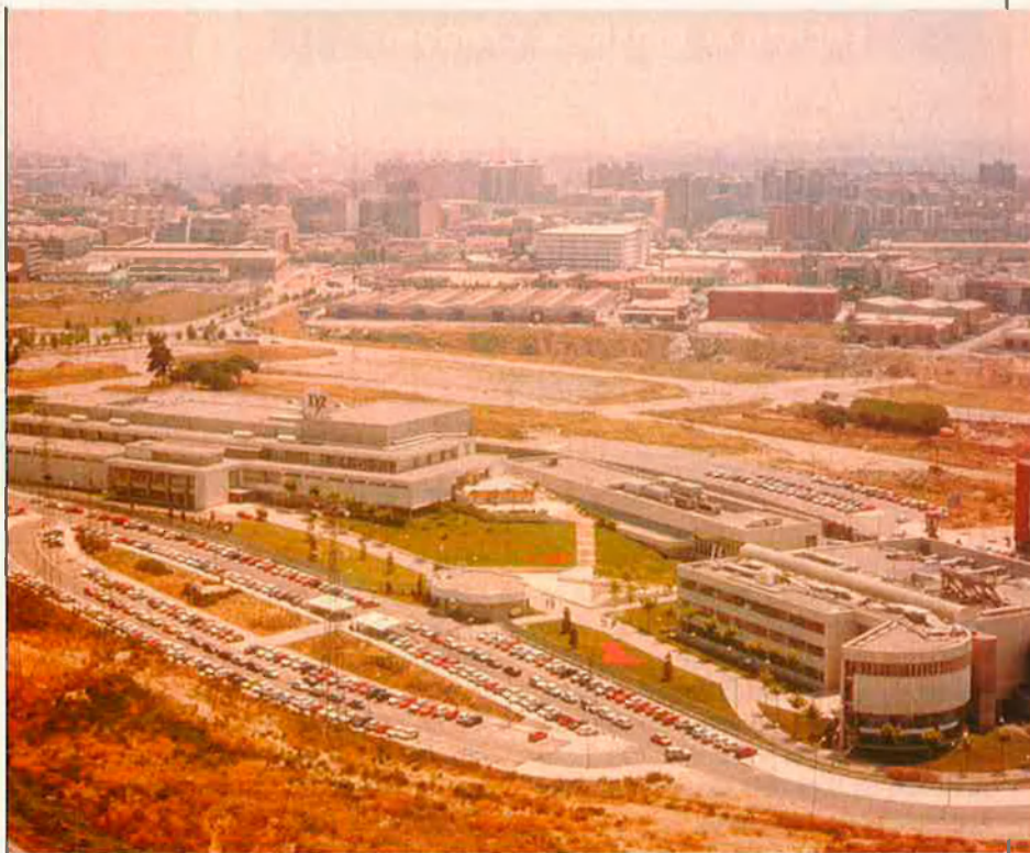
Instal·lacions de TV3 a Sant Joan Despí.

Catalunya Nord vol veure TV3 i Canal 33. Les raons són òbvies i parlen dels lligams culturals i lingüístics entre aquests tros de l'estat francès catalanoparlant i la resta del país. Per afavorir-ne la recepció, l'Associació Onofre d'Alentorn va demanar diverses ajudes tant al govern regional com a l'Europeu per a instal·lar una xarxa de repetidors. Així doncs, l'organització, amb seu a Prada del Conflent, va rebre dues ajudes. Una de la Direction de l'Enseignement, des Sports, et de la Culture de la Region Languedoc-Roussillon, consistent en 40.000 francs francesos, unes 800.000 pessetes, en concepte de subvenció de la xarxa per a les televisions catalanes. També la Comissió de les Comunitats Europees va atorgar una subvenció de 7.200 ecus, vora un milió de pessetes, per al mateix efecte. És a dir la recepció dels dos canals catalans va ser subvencionada per dues institucions de suficient prestigi com el govern francès, d'àmplia trajectòria centralista, i la Comunitat Europea. Però, mentre la Comunitat Europea dóna suport a la llibertat de les ones, l'estat espanyol actua d'una manera molt diferent.