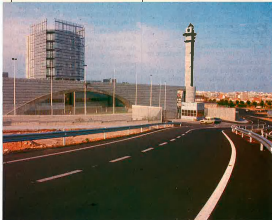
Instal·lacions de TVV a Burjassot.

que la reciprocitat dona lloc a "problemes legals seriosos", ja que vulnera la llei de tercer canal que limita la recepció dels canals autonòmics al seu territori. Les Corts Valencianes, doncs, contrarien la llei perquè han aprovat una resolució que acordava "manifestar el seu suport a totes les iniciatives de ciutadans, entitats i de la mateixa Generalitat encaminades a fer efectiu el dret constitucional a la informació (...) i a fer realitat la reciprocitat entre TVV i TV3 i amb la resta de comunitats autònomes en els territoris respectius". També el Parlament de Catalunya va manifestar "el seu suport i el seu encoratjament a totes les iniciatives de ciutadans i entitats encaminades a fer efectiu el dret constitucional a la informació".