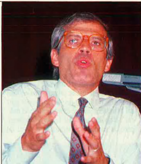
Josep Borrell, ministre de Transports i Comunicacions.