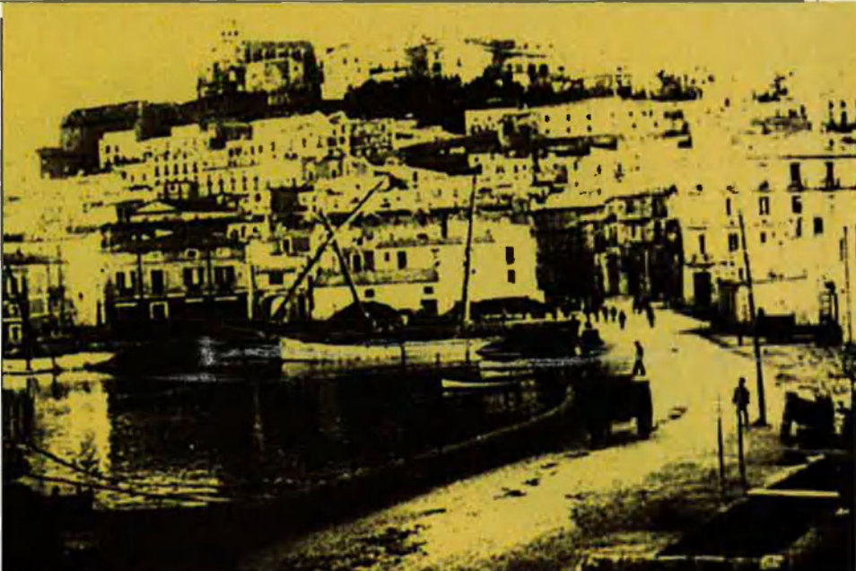
Fotografies d'Eivissa de començaments de segle.

És comprensible que el suïcidi de Benjamin a Portbou haja mobilitzat peregrins i homenatges, sobretot amb motiu de la celebració del cinquantè aniversari de la seua mort. Hi ha hagut benintencionats buscadors de relíquies. Hi qui ha intentat localitzar, sense èxit, la tomba on jauen els seus ossos; s'ha tractat de compensar aquest esborrament de les seues traces erigint-hi una làpida a la seua memòria. Hi ha hagut fins i tot recerques quasi detectivesques, també sense resultat, per tal de trobar cert manuscrit de què parla Lisa Fitko en el seu testimoni d'aquella caminada a través dels Pirineus, uns papers que Benjamin portava en una maleta i