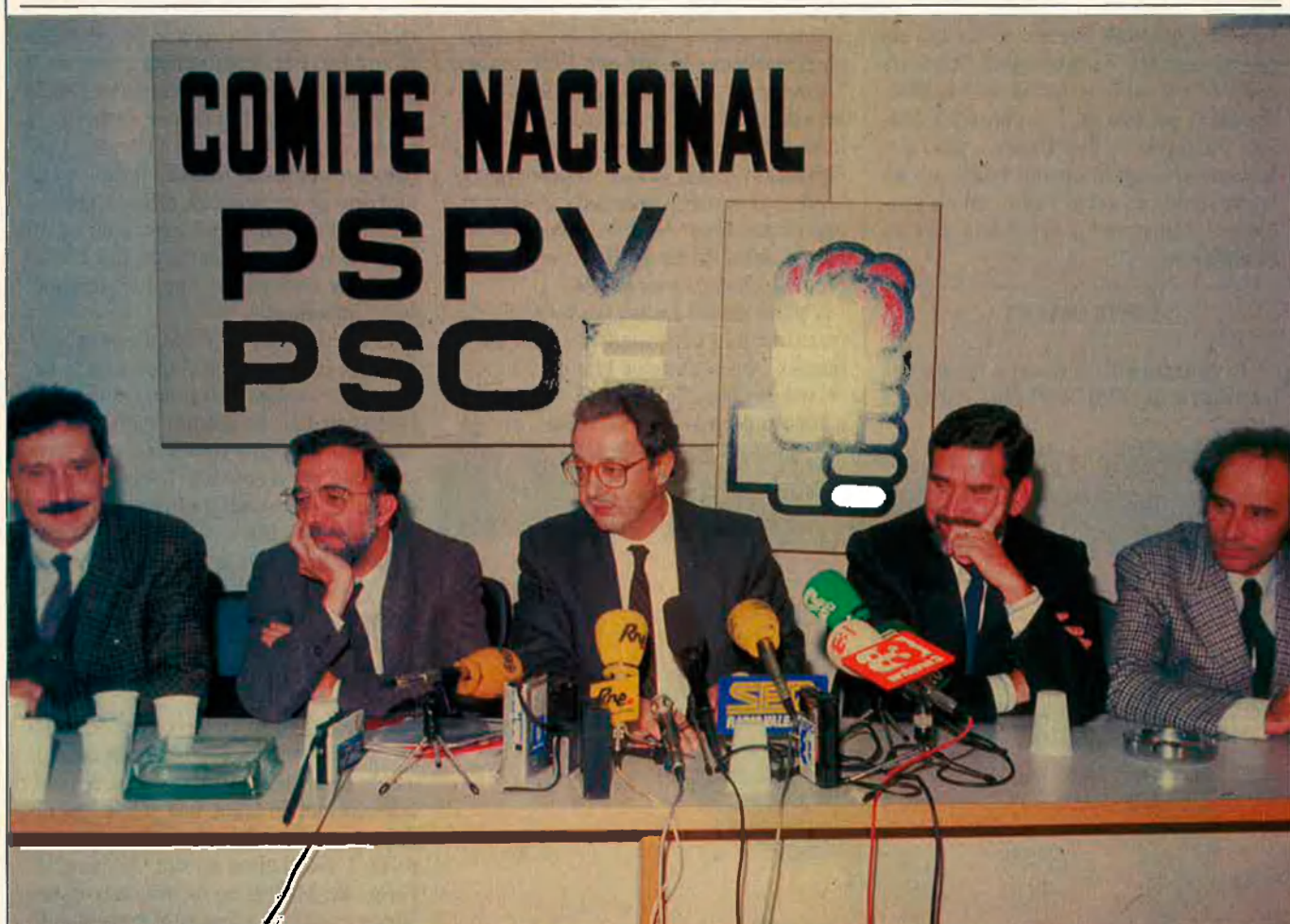
Els que es van moure no van eixir en la foto.