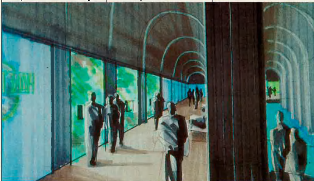
El visitant de l'exposició tindrà sensacions físiques (olors, humitat, etc.), segons el lloc on es trobi.

Olimpíada Cultural espera que l'exposició tingui ressò internacional i, a més de viatjar, tal com tenen previst, a Madrid, pugui recórrer altres països. És una aposta innovadora que adopta noves tècniques per a fer més cridaner el missatge divulgatiu. El visitant haurà comprès, en sortir, la complexitat i diversitat de la biosfera i el seu valor, amb un coneixement dels perills que l'amenacen. Una visió global del planeta, per a no oblidar que els Jocs Olímpics no són només internacionalisme en el terreny esportiu.