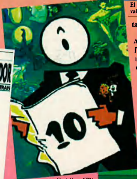
Cartell del 10 Saló del Còmic.

València còmic ha tingut un teló de fons atzarós i problemàtic: hi havia prevista una ajuda del Consell d'Europa que finalment no ha arribat, ha passat per diferents responsables... Però el cas és que la criatura camina. I, de moment, amb bon peu.