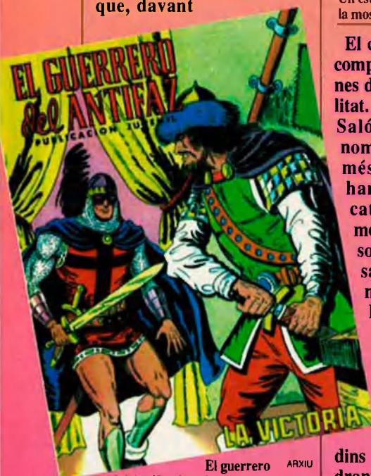
El guerrero del Antifaz, la primera generació del còmic valencià.

Potser no ha estat la intenció dels organitzadors, però la iniciativa València còmic sembla, si més no, una manera força engrescadora de guarir els greuges del 92, la seua absència del tiberi d'oripells i prebendes disfrutats per altres ciutats. Veritat o no, el fet és que la iniciativa València còmic, ja en marxa amb les mostres La