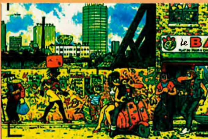
Un estiu al suburj, de Jano, a la mostra Ca c'est la France.

N o organitzen desoris. Treballen en silenci i tots sols a casa. Són poc proclius a l'exhibicionisme social. Almenys això diu el tòpic respecte al món del còmic. Però, com tots els tòpics, només conté una part de veritat, la del treball solitari. Pel que fa a la vida social, no es vol perdre ningú les iniciatives sobre el còmic, ni dibuixants, ni editors, ni llibrers, ni els lectors empedreïts i incorregibles d'aquesta literatura i que, davant