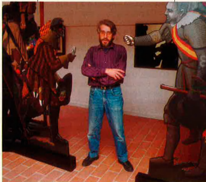
"Al cap i a la fi, dir nació és com dir cultura."

—Jo pense que un gran percentatge sí i un altre, difícil de quantificar, no. De tota manera no crec que siga culpa dels artistes sinó dels mateixos de sempre, de l'especulació i el mercat que hi ha al voltant de l'art. Els més avariciosos i desvergonyits del món estan per aquestes coses. A banda d'una gent molt honesta, hi ha la màfia que juga amb els preus. Possiblement hi han tingut a veure les institucions, que han sobrevalorat coses, han promogut artistes per interessos particulars, etc.