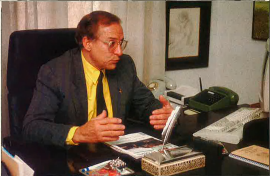
Un 70% de les disfuncions erèctils són per causes orgàniques i només un 30% són degudes a causes psíquiques. PERE CARMONA

Si la impotència és orgànica, el tractament que se li pot aplicar és el farmacolò-