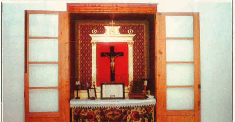
Capella empotrada amb els efectes litúrgics suficients per a improvisar una homilia.