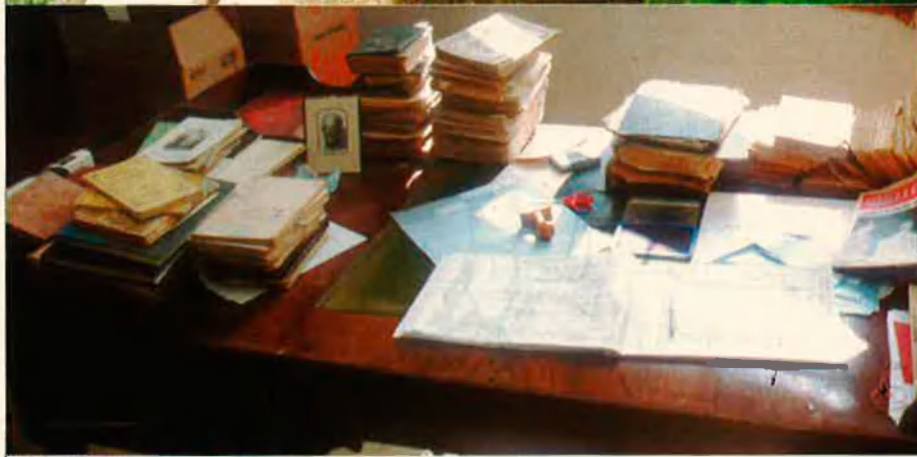
Dalt, pati interior; baix, la biblioteca amb l'escriptori.