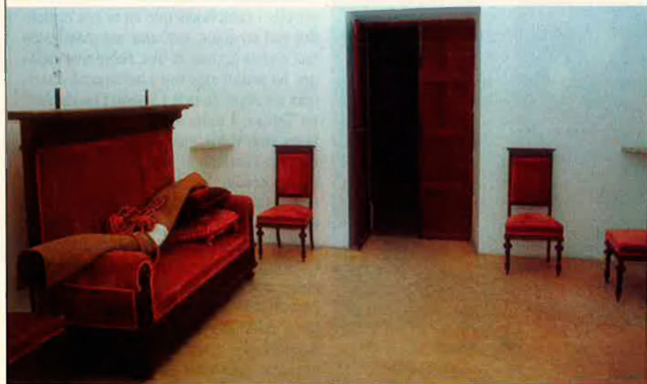
Un sofà papal i unes cadires cardenalícies.