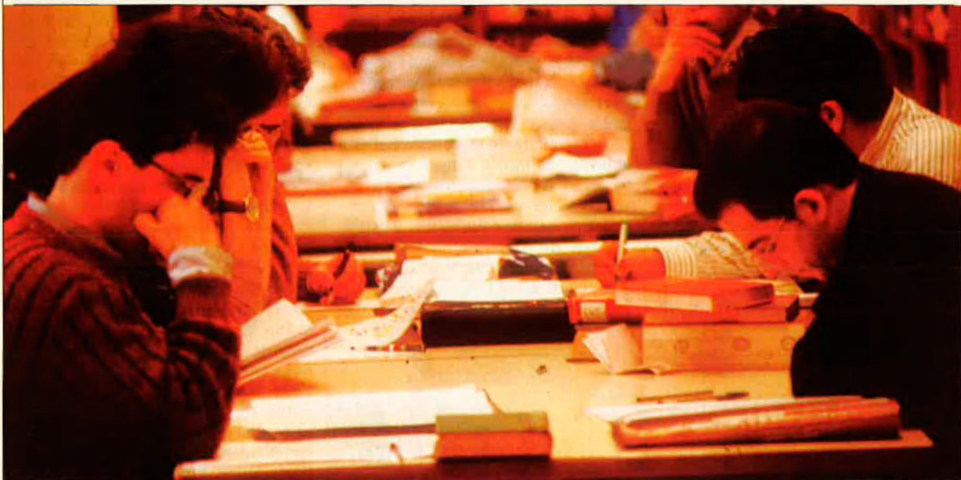
Els crítics s'han fixat cada vegada més en la producció novel·lística valenciana.