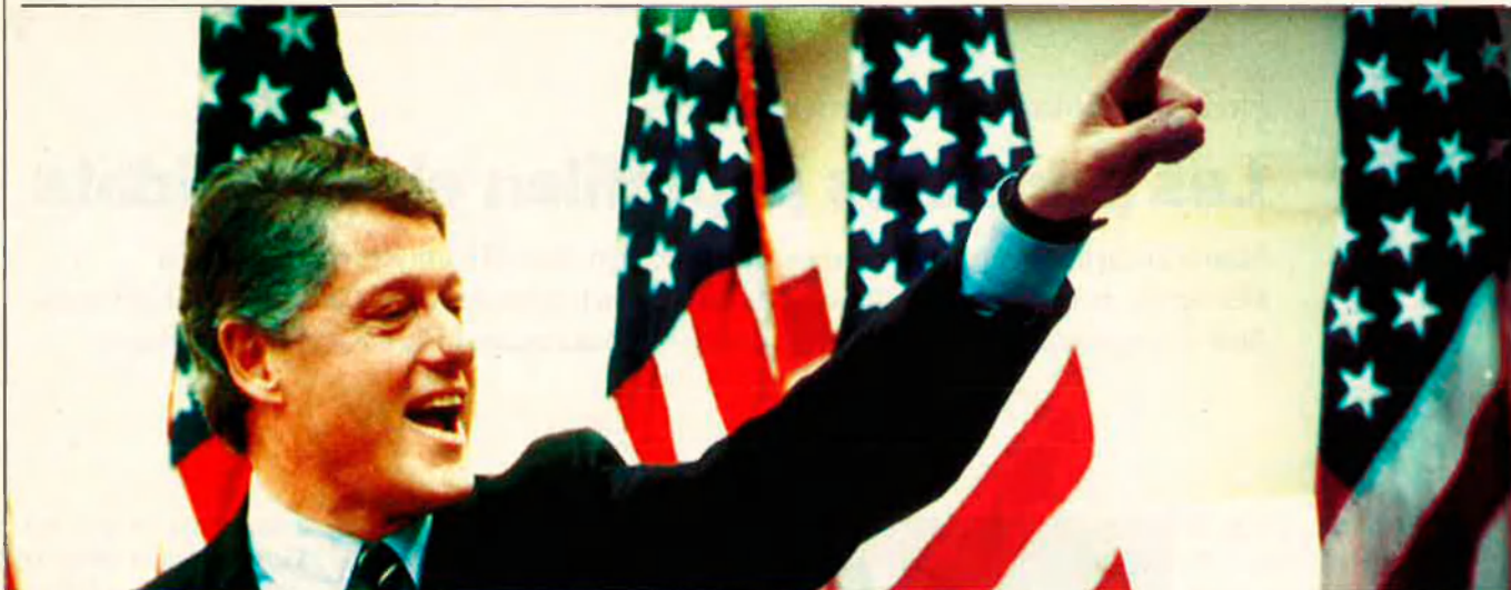
Bill Clinton serà probablement el candidat demòcrata a la Casa Blanca.