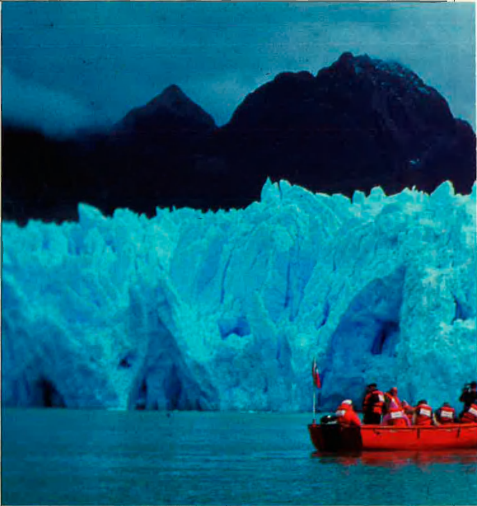
Parc Nacional Laguna de San Rafael (Chile).

— Si érem una entitat estatal i a més dedicada a la cultura, no podíem fer solament un pavelló 'maco'. Calia fer un pavelló que "digués" alguna cosa. D'altra banda, si volíem parlar de 'sistemes' de Sud-amèrica, qui millor sap què s'ha de dir és la gent d'allà. Per tant, era ineludible anar-hi. A més vam pensar que l'Expo era realment una oportunitat que podien tenir algunes entitats sud-americanes de sentir-s'hi representades. Vam creure que el més oportú era de connectar amb un bon nombre d'organismes a fi que hi hagués una autèntica col·laboració. Hem estat bastant idealistes i aquest idealisme es referma quan trepitges aquelles terres, quan veus la misèria que hi ha, les dificultats que tenen... Et tornes molt més combatiu, vols que aquella gent en surti beneficiada, si més no fer-los conèixer... Aquesta és la raó per la qual, si mires els crèdits, veuràs que hi ha representats aproximadament uns vuitanta organismes llatinoamericans de dinou països, des de museus a entitats no governamen-