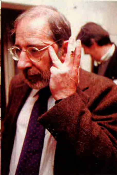
Alvaro Siza ha rebut recentment distincions de les universitats valencianes.