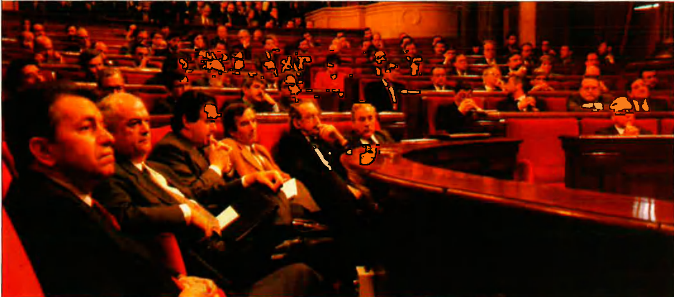
El Parlament de Catalunya escoltà diverses propostes de sobirania.