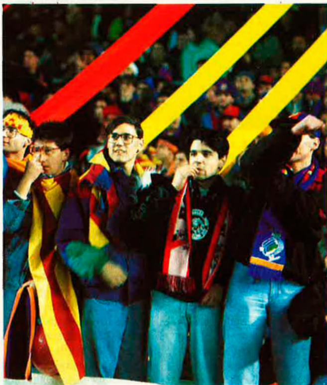
El Barça aplega 120.000 socis.

I mentre els partits tradicionals conti-