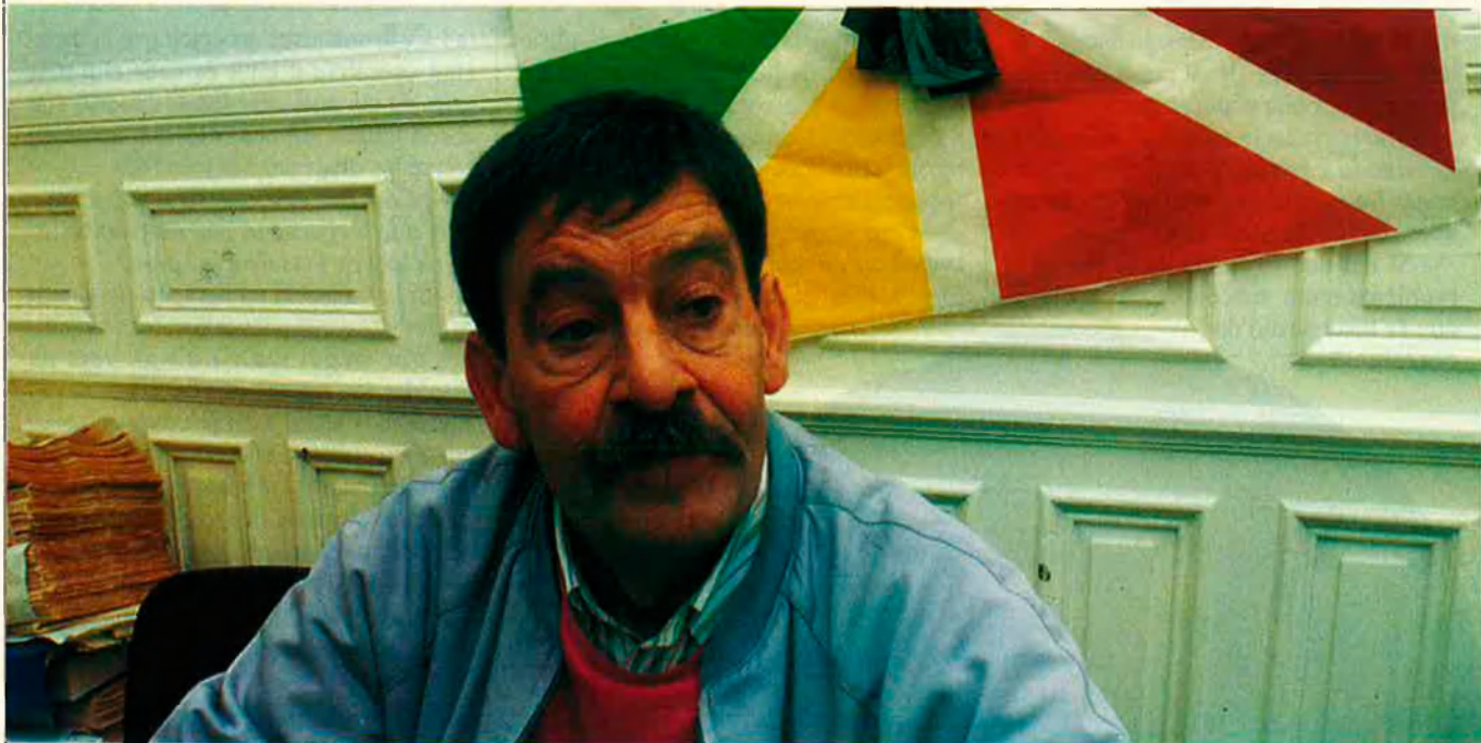
“La normalització política s’ha de donar amb l’acabament de la violència basat en el reconeixement del dret d’autodeterminació”.