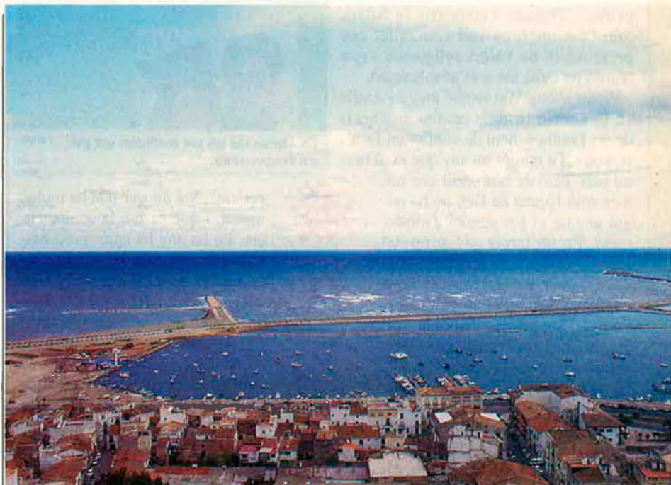
El gran espill del port de Dénia canviarà prompte el seu aspecte.

Començat durant el segle passat, actualment, només un 10% dels 650.000 m 2 de dàrsena abrigada tenen prou calat per a garantir una navegació segura. L'àmplia superfície d'aigua, l'espill, ha caracteritzat les vistes de Dénia, però ha tingut un rendiment econòmic molt baix. Catalogat com a industrial, el port de Dénia va començar a desenvolupar-se per a permetre als vaixells carregar i exportar la pansa. Però els problemes de calat dificultaven de tal manera l'activitat comercial que, prompte, es va reduir i els pesquers es convertiren en els seus usuaris més importants. La seua activitat, juntament amb la del club nàutic i l'explotació de la línia Dénia-Eivissa, ha animat la utilització del port, però els problemes continuen. Cada cert temps,