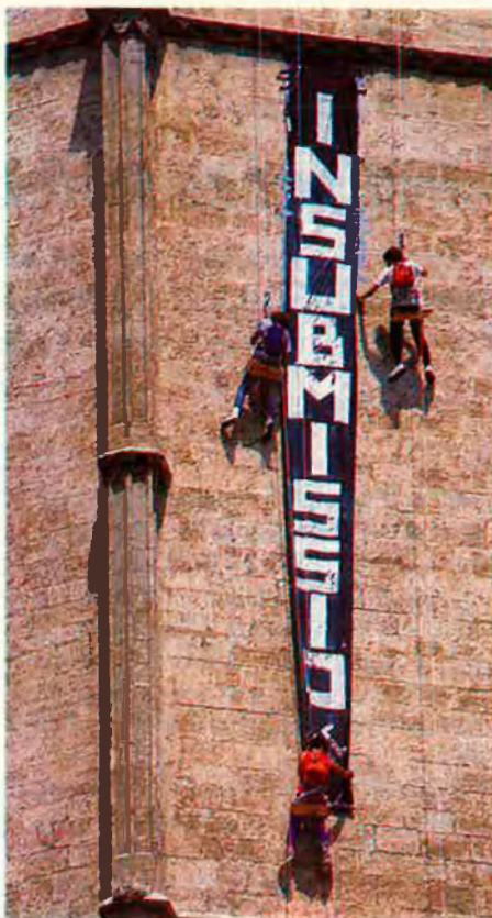
La PSS continua sent rebutjada.

El Parlament de Catalunya aprovà el 22 de novembre del 1990, un avantprojecte per a modificar la Llei d'Objecció de Consciència amb els vots favorables d'IC, CiU i CDS, si bé el PP i el PSC s'hi van oposar i ERC es va abstenir. Segons aquest darrer partit, el problema està en l'obligatorietat de fer el soldat i que la proposta no resol res. Aquesta proposta inclou cinc punts genèrics i demana una llei d'objecció "d'inspiració progressista i