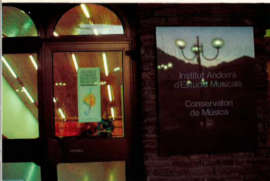
Andorra vol "turisme de qualitat", ARXIU