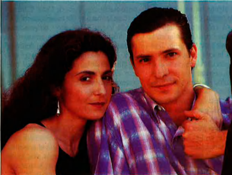
Dalt, Amor a primera vista . A la dreta, Les últimes tendències de la moda arriben als programes de nit com El joc del segle , de TV3.

temps. No tots poden ser punters com l'esmentada Marisol, les hostesses de La parada , o la protagonista d' Amor a primera vista , que aguanta fins i tot vestits que no es veuen al carrer, només a les passarel·les. Als informatius, en canvi, i a altres programes conduïts per periodistes allò més important és que la