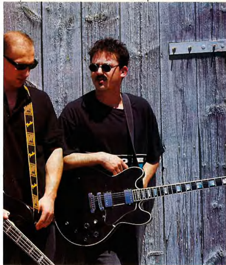
FRATS I CAMPS

nafra: ¿quina diferència hi ha entre el primer àlbum i el segon? "Al primer disc no ens coneixia ningú i nosaltres vam apostar per una companyia discogràfica. Al segon, la companyia ha confiat molt més en nosaltres. Sempre havíem fet les coses per lliure i de cop i volta ens trobem en