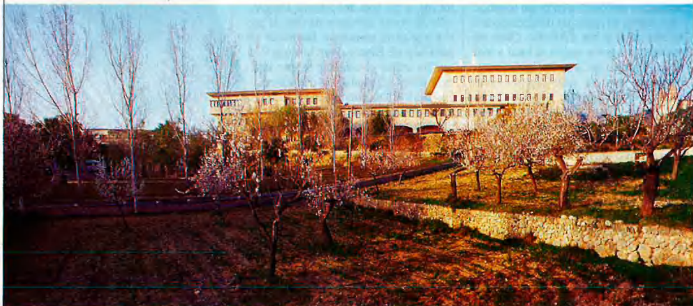
Ajuntament de Calvià.

Tardor de 1991. Els rumors sobre intents de compra de regidors s'intensifiquen. Al mes d'octubre el Diario de Mallorca publica en una secció de breus titulada "Llama la atención": "¿Quién será el próximo Judas del ayuntamiento de Calvià?". A principis de novembre EL TEMPS publicava que existia la possibilitat de canvis a l'Ajuntament, ja que, se-