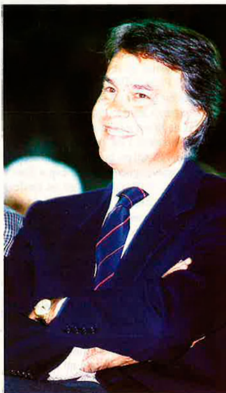
González no ha tingut problemes per a pactar amb el PP. RAFA GIL

En definitiva, el que fa el Pacte és sancionar —de forma definitiva?— l'existència de tres grups. El primer, les anomenades comunitats històriques (Catalunya, País Basc, Galícia, i també Navarra). Un segon amb Canàries, Andalusia i País Valencià que, tot i no tenir el nivell competencial de les primeres, sí que estan molt per sobre les "germanes pobres". I finalment les comunitats que no han sabut, o no han volgut, fer valer els seus drets i que es mantenen un pla de competències menor. Entre elles, les Balears.