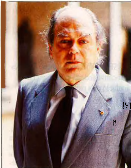
Jordi Pujol, el recel.