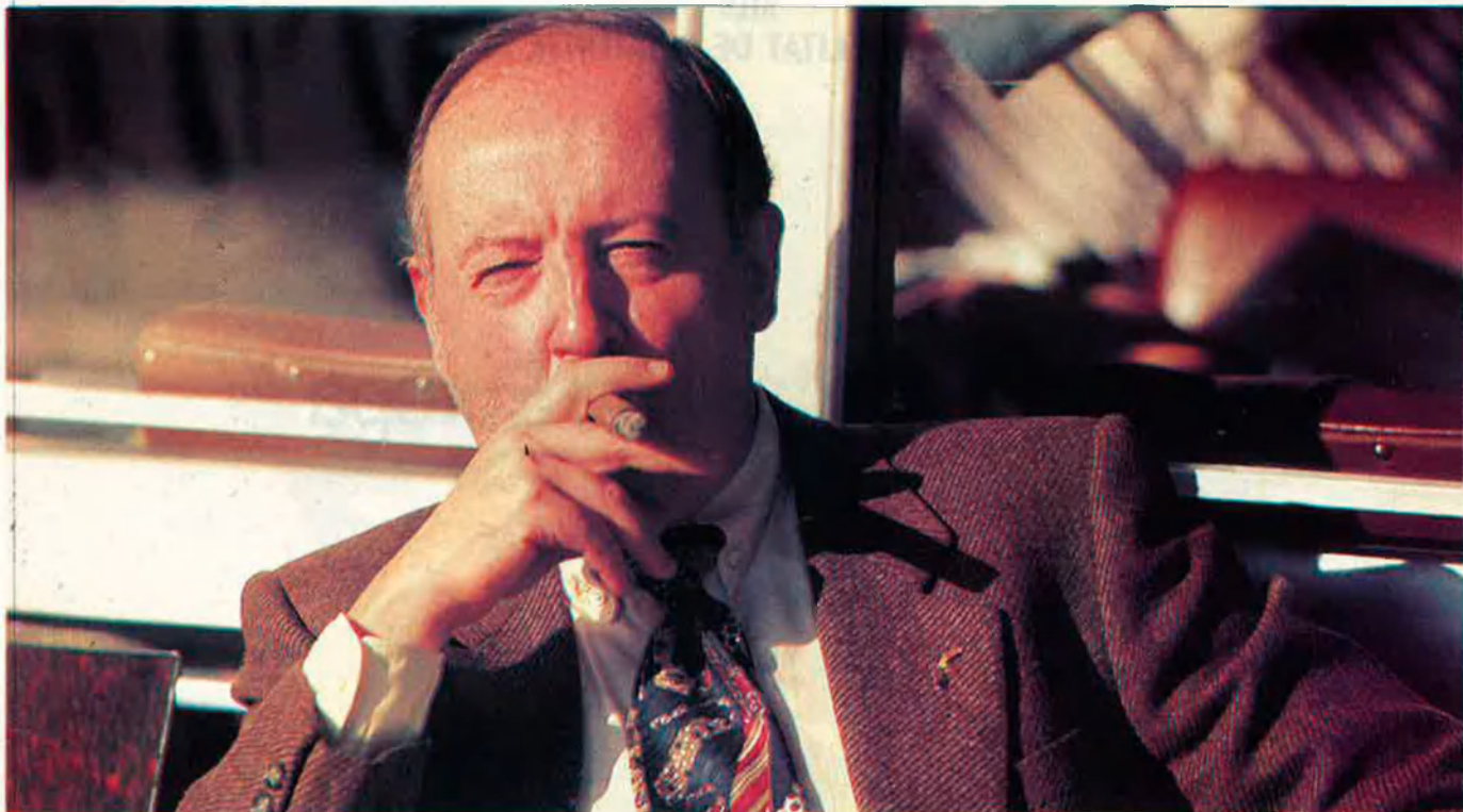
“Sóc francès. He nascut a París i em sento de cultura francesa”.