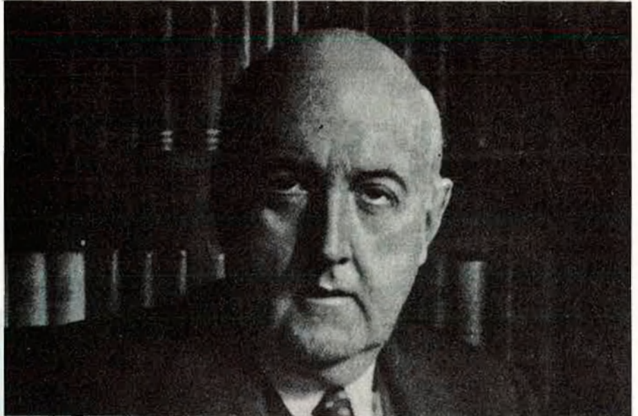
"El meu pare escrivia per guanyar-se la vida".

"Quan vaig començar a escriure 'El día de siempre', articles diaris a Tele/exprés , a final dels seixanta, tenia al cap L'aperitiu , els articles que el meu pare havia escrit abans de la guerra, al Mirador . Volia adaptar allò. Els articles s'han de fer llegir, i ja està. Ni homilia ni sermó laic. Després vaig derivar cap als gustos personals, cap al meu món personal, però al principi era això: adaptar L'aperitiu . És que als anys trenta Barcelona no era tan lluny de París com als seixanta; ni com ara, ¿què t'haig de dir? El meu pare seguia Valéry-Larbaud, i a París hi triomfaven Maurice Chevalier i Joséphine Baker, que ell va fer venir a Barcelona, al Paral·lel. Impossibile per a mi i per a