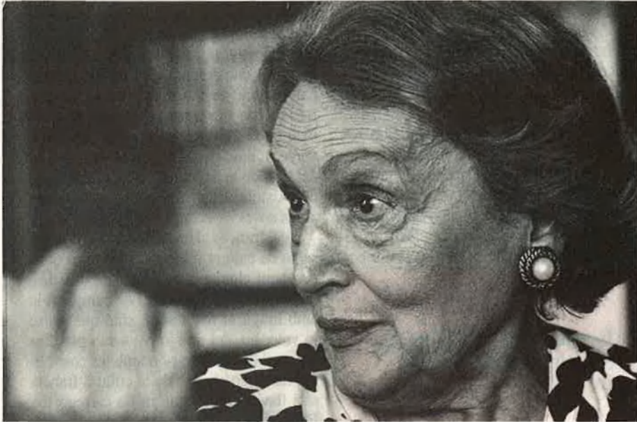
"La realació amb la meua mare era la clàssica d'amor--odi".