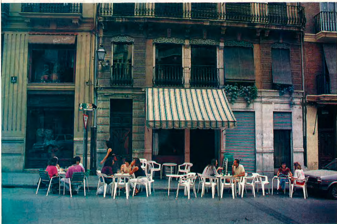
Els cafès i la vida nocturna no han aconseguit parar la degradació del barri del Carme.

El barri del Carme és sens dubte el més entranyable de València, però el seu estat de degradació i la falta d'una aplicació rigorosa dels plans de restauració pot convertir-lo en un record.